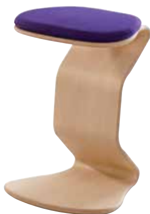
1116 96, 32 040