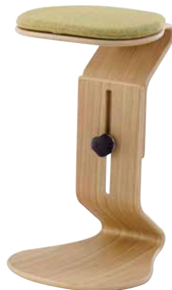
1119 94, 32 049