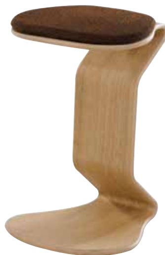
1117 94, 32 045